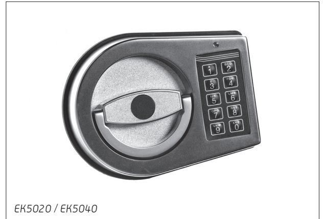
EK5020 / EK5040