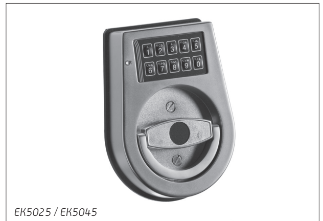
EK5025 / EK5045