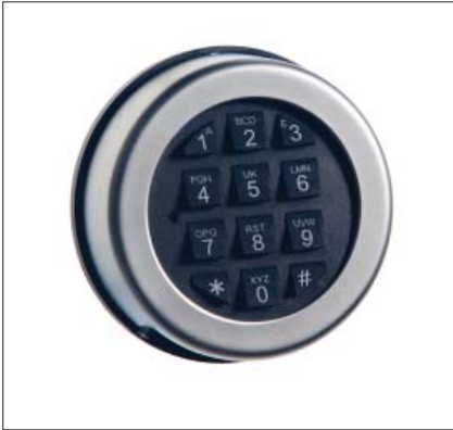
AL2010 / AL2020