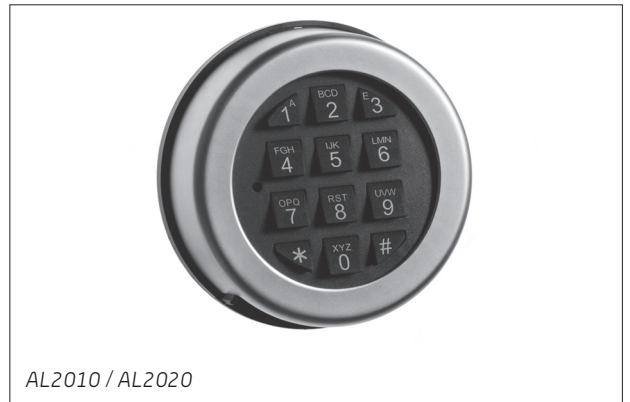
AL2010 / AL2020